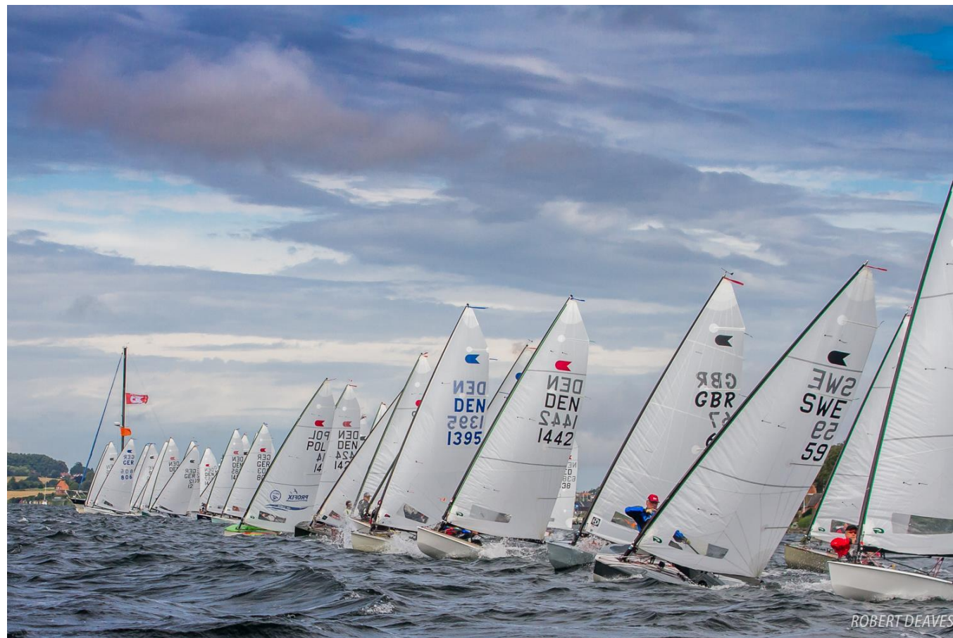
Parcours olympiques et parcours «banane»